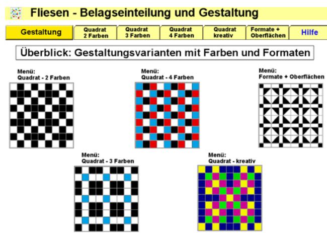
Abb. 2: Programmteil Gestaltung

Der Programmteil „Belagseinteilung“ versteht sich in erster Linie als digitales, planerisches Hilfsmittel, um einen berechneten und visualisierten Verlegeplan zu erstellen, aber auch als baukonstruktiver Ratgeber für Details , als Nachschlagewerk für Verlegeregeln und als Formelsammlung mit beispielhaften Berechnungen für die jeweiligen Bauteile.